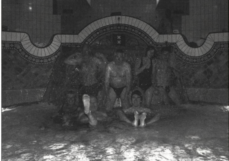
Zwemmers in het Zuiderbad, Amsterdam.