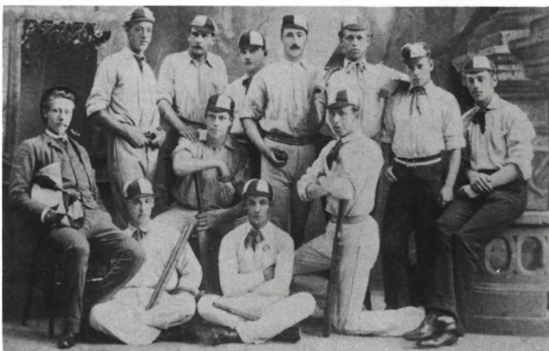
H.C.C. in 1884