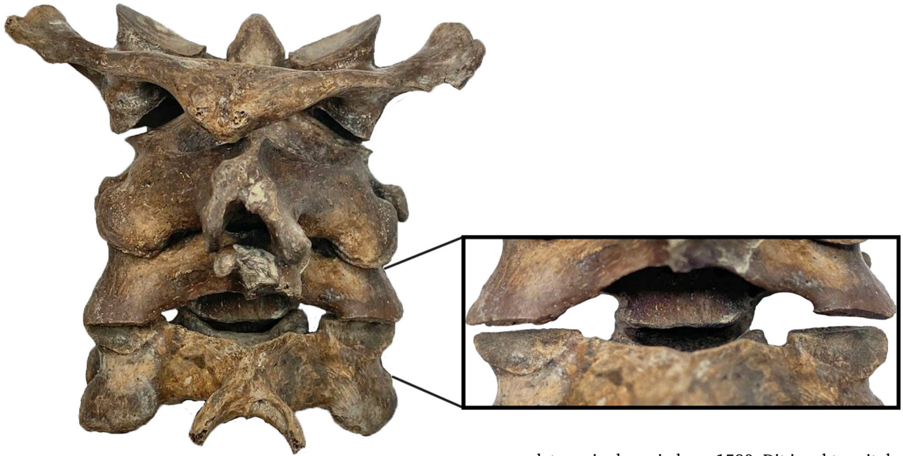
Fig. 3. Boven: vier nekwervels van het skelet in spoor 21 met binnen de uitvergrotting haksporen, onder: onderzijde van de tweede wervel (draaier of epistropheus) van het skelet uit spoor 18, waarop de 'snijvlakken' duidelijk zichtbaar zijn. Dit individu is onthoofd tussen de tweede en derde nekwervel. Schaal 1:1.