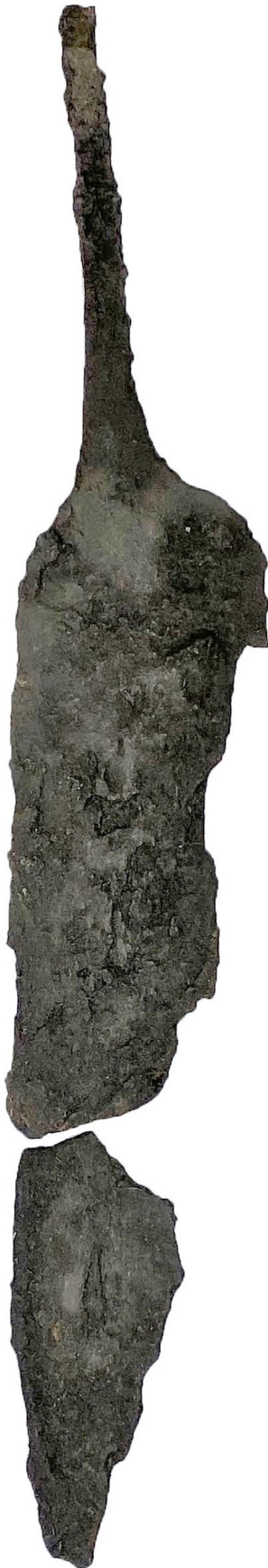
Fig. 4. IJzeren mes, gevonden in de grafkist van spoor 18. Schaal 1:1

zijn bijgezet? In de historische bronnen komt een drietal mogelijke namen naar voren.