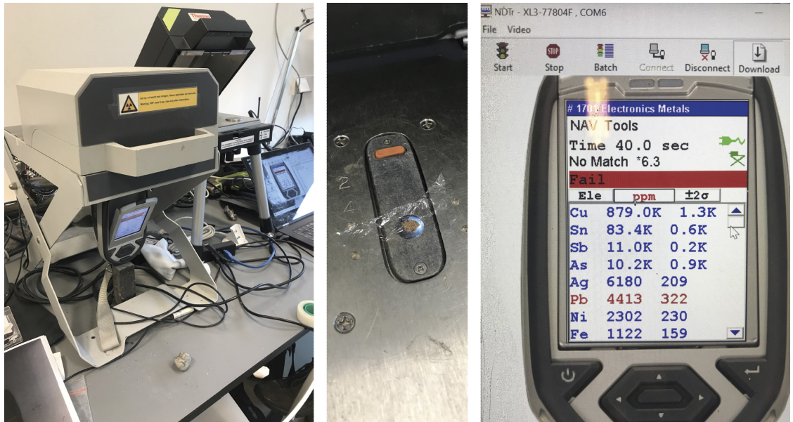
Fig. 2. Opstelling van de pXRF (hangend onder de meettafel) met afdekkende loodklep (links), de meetsituatie van het uitgeslepen monster (midden) en een beeld van de ruwe meetgegevens (rechts).

Odoorn via Emmen naar Erica loopt (fig. 3). Deze rug kent hoogtes tot ca. 28 m boven NAP, terwijl de vondstlocatie 1,2 km westelijk ervan op ca. 17 m + NAP is gelegen. Het stroomgebied van de Sleenerstroom vormt – ca. 2,5 km meer westelijk – het laagste punt van het landschap op ca. 15 m + NAP. De vondstlocatie lijkt in een overgangszone van de rugflank (ca. 17 m + NAP) naar het stroombed van de Sleenerstroom te liggen. Op basis van het aanhangende sediment (zand) en de zwartgroene kleur van het buitenoppervlak (patina), heeft de bijl het grootste deel van zijn leven in waterverzadigd sediment doorgebracht, maar is hij ook aan zuurstof blootgesteld geweest. Het is bekend dat vele bronzen voorwerpen worden achtergelaten, mogelijk als offers, met name in de natte, lagere delen van het landschap (Essink & Hielkema 2000; Fontijn 2003). Maar waar woonden de mensen die deze bijl wellicht nabij dit beekdal hebben achtergelaten?