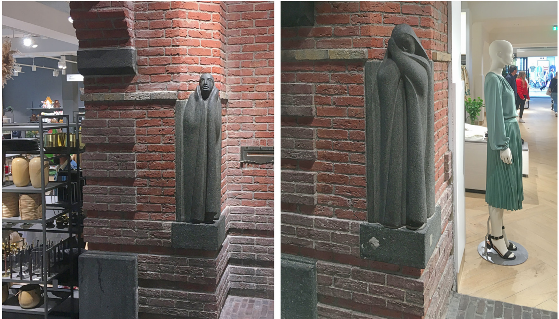
Fig. 3. Twee van de vier nonnenbeelden in de nieuwe H&M.

kunnen aanbieden. En dan laat ik de bijzondere vondsten die je kan doen nog buiten beschouwing.