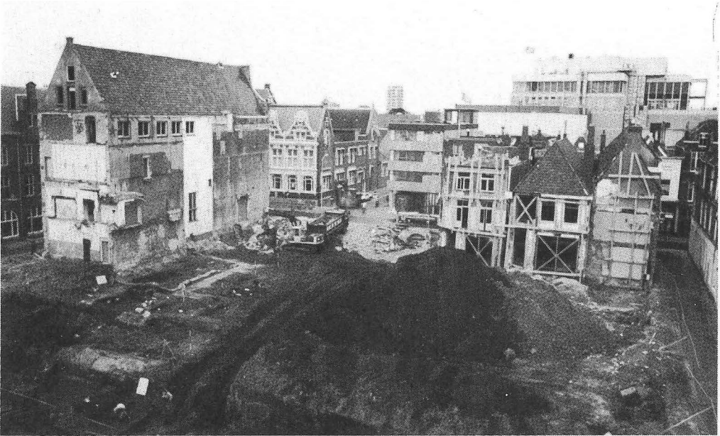
Fig. 1. Overzichtsfoto van de opgraving Wolters-Noordhoff 1990. Aan de linkerzijde het Calmerhuis, geheel rechts een deel van het BAI.

Tot aan de 12e eeuw is een langzame verplaatsing van de bewoning in de richting van de Oude Ebbingestraat te bespeuren. Mede door de snelle ophoging met humeus materiaal zijn de palen van een