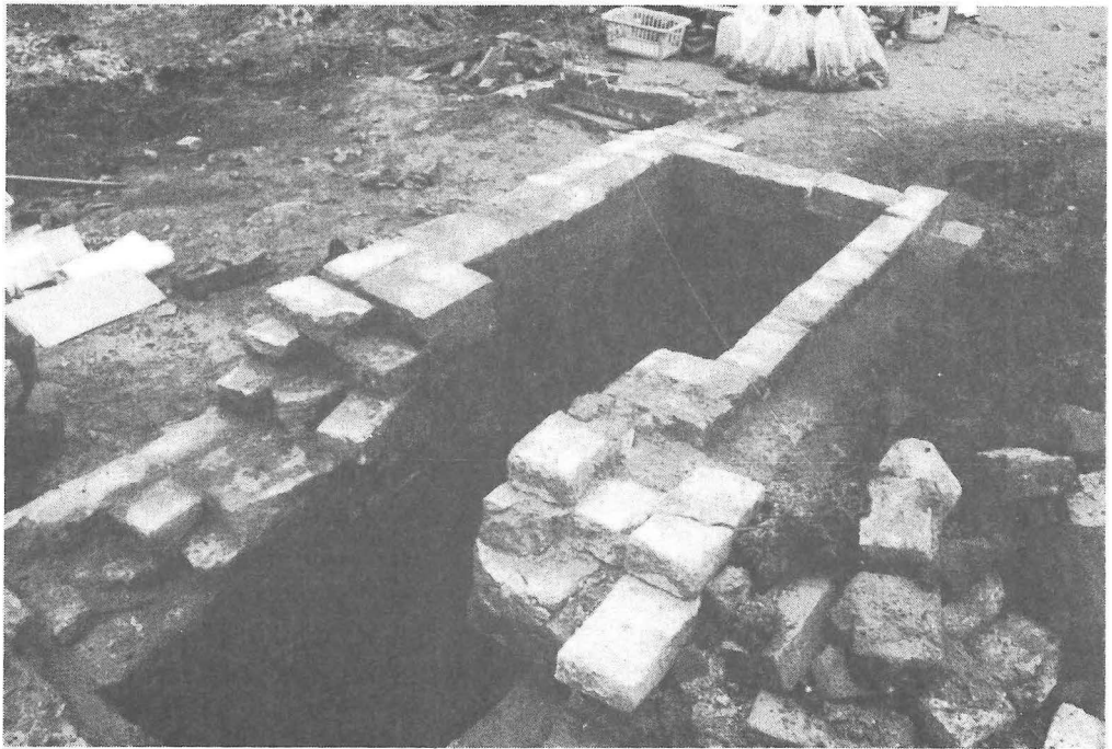
Fig. 2. Beerput uit de 13e eeuw. Op de voorgrond een uitsparing in de hoek van de fundering van een groot 13e-eeuws huis.

huis van bijna buitensporige afmetingen. Het grondplan meet ca. 8×16 m, bij een muurdikte van ca. 1,4 m (sousterrain) en 1 tot 1,2 m (zaal). De oorspronkelijke begane grond (nu het sousterrain) wordt gevormd door een overwelfd vertrek, dat vanaf de straatzijde toegankelijk was. Op een meter of drie boven straatniveau lag de ingang van de woonverdieping. Deze zeer hoge 'zaal' (6,5 m) was ongedeeld en voorzien van een grote stookplaats in de achtergevel. Halverwege deze verdieping bevond zich boven de stookplaats de 'insteekverdieping', vermoedelijk als slaapvertrek gebruikt. Buitenlicht viel de zaal binnen via kleine romaanse ramen, die hoog in de gevel, net onder de balklaag van de eerste verdieping waren geplaatst. Deze ramen waren voorzien van traliewerk en mogelijk gebrandschilderd glas-in-lood. Aan de binnenzijde konden ze met een houten luik worden afgesloten. Boven de zaal lagen nog twee verdiepingen en een zolder - waarschijnlijk in gebruik als opslagruimte