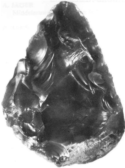
Fig. 1. De MTA-vuistbijl van Zeijen (lengte 9,1 cm) met natuurlijke splijtvlakken aan de basis; particulier bezit.

(mogelijke) midden-paleolithische voorwerpen te melden aan de auteurs.