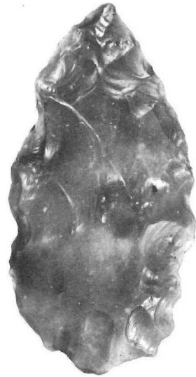
Fig. 2. De Mauern-bladspits van Emmen, lengte 7 cm.

In recent years there has been increasing interest in the Middle Palaeolithic. Amateur archaeologists of the northern Netherlands are becoming more and more capable of recognizing these often severely patinated and frost-split pieces. In the northern Netherlands this has resulted in the discovery of more than one hundred artefacts; flakes, cores and different kinds of tools. In addition several hand-axes were found which probably can be attributed to the Moustérien de tradition Acheuléen, type A. A very interesting recent find is a leaf point of the 'Mauern' type which can be dated to