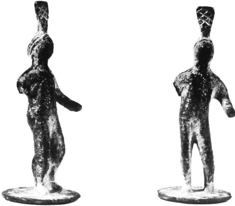
Fig. 1. Bronzen beeldje Groninger Museum Inv. 1964/VI.2.

beeldje werd gevonden, in dezelfde plaats op dezelfde wierde. Dit beeldje bevindt zich in particulier bezit en werd onder mijn aandacht gebracht door de toenmalige conservator van het Groninger Museum J.W. Boersma.