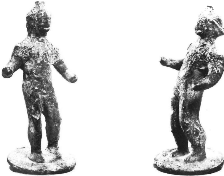
Fig. 2. Bronzen beeldje, privécollectie.

in huis werden gegoten van brons. De vraag wat de figuurtjes voorstellen is niet te beantwoorden voordat duidelijk is waartoe ze gediend hebben. Dan kan het mogelijk zijn om na vergelijking met andere voorwerpen de identiteit van de beide figuurtjes te weten te komen.