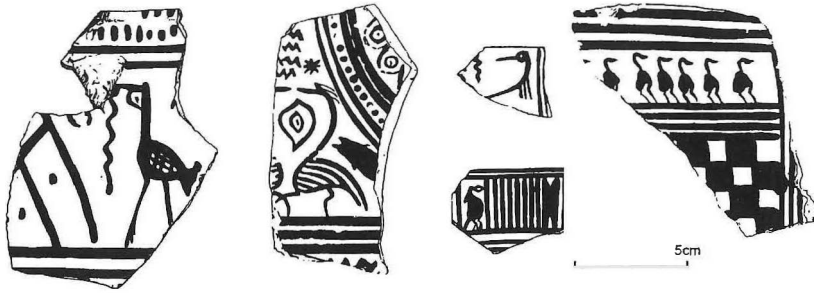
Fig. 2. Laat-geometrisch aardewerk uit de opgravingen van Vollgraff te Argos met vogelafbeeldingen. Getekend door A. Roes (1953).

Vollgraff schrijft dat Klassiek, Hellenistisch en Romeins materiaal (vanaf ca. 480 v.Chr.) in de hele binnenplaats slecht vertegenwoordigd is. Over de tempels schrijft hij: "Op en om de grondvlakken van de beide tempels is een groot aantal fragmenten van geometrisch vaatwerk, daaronder ook van zeer groote en zware potten, gevonden. ... het aardewerk ... zal afkomstig zijn van wijgeschenken en offers bij oudere altaren van dezelfde godheden." Een klein deel van het aardewerk is gepubliceerd (Roes, 1953). Het betreft laat-geometrisch aardewerk, dat gemaakt werd tussen ca. 750 tot 700 v.Chr. Het is gedecoreerd met geometrische patronen; soms ook met figuratieve voorstellingen.