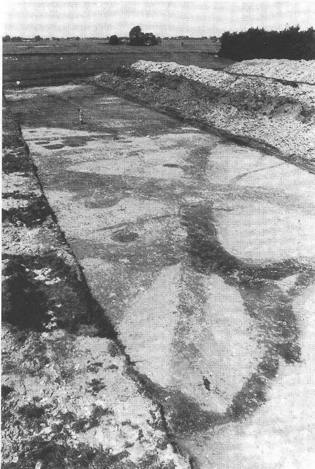
Fig. 1. Overzicht van een van de vlakken in werkput 3. De grondsporen (sloten, greppels en kuilen) tekenen zich duidelijk af in de natuurlijke kwelderafzettingen.

Het eerste deel van de vraagstelling kon al de eerste week beantwoord worden. Sporen in de vorm van greppels, waterputten, afvalkuilen en paalsporen, en zelfs verschillende (vroeg)middel-