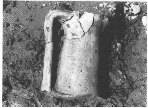
Fig. 2. Hals van een Romeinse amfoor, een van de oren is nog aanwezig.

kende naam) werd Romeins steunpunt. Juist deze combinatie van import en inheems aardewerk kan veel nieuwe inzichten opleveren over de confrontatie tussen de Friezen en de Romeinse soldaten. Daarbij is het Romeinse aardewerk, met name de terra sigillata, scherp te dateren waardoor ook de datering van inheems aardewerk aangescherpt kan worden.