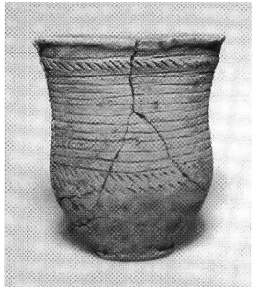
Fig. 1. Standvoetbeker van het type 1a uit het grote EGK-graf.

Ook op het terrein van het toekomstige ontvangstplein werd naar aanleiding van de AAO besloten een groter oppervlak te onderzoeken. Dit leverde drie huisplattegronden, twee waterkuilen, vijf hutkommen, een schuurgebouwtje en een