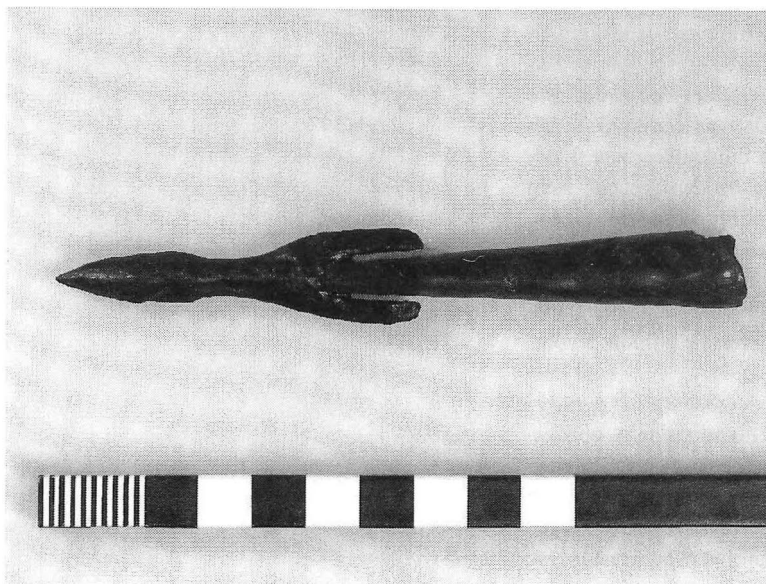
Fig. 3. Speerpunt met weerhaken uit afvalkuil.

werd o.a. mooi versierd Angelsaksisch aardewerk (fig. 2) en een aantal ijzeren voorwerpen, bestaande uit een knijpschaartje, een speerpunt met weerhaken (fig. 3), een pijlspits en een onderdeel van paardentuig gevonden. Twee afvalkuilen bevatten delen van een smeltoventje, waaronder