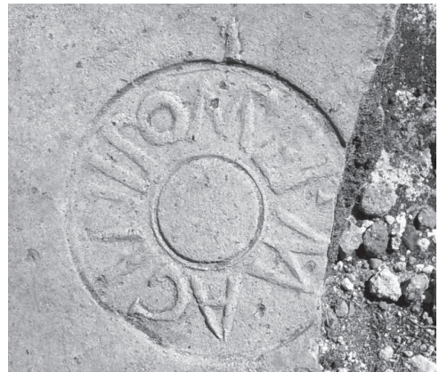
Fig. 2a en 2b. Gevonden dakpanstempels, 2000 (a) en 2003 (b) (tek. R. Aalders, 2003).

een sociale en culturele uiting zijn van een vooral consumerende elite. De modernisten zouden, op hun beurt, deze visvijvers verbinden met een toenemende commercialisering van de villa als economische eenheid.