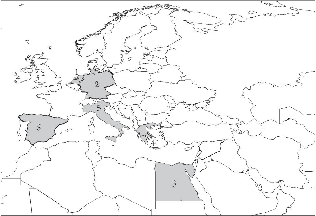
In dit nummer: 1) Nederland, 2) Duitsland, 3) Egypte, 4) Griekenland, 5) Italië, 6) Spanje.