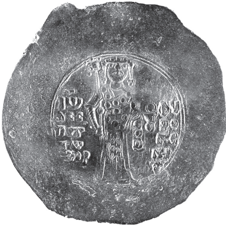
Fig.2. Munt van de Byzantijnse keizer Ioannis II, 1118–1143.

het Herakles/Ruiter type met het monogram ANTI, vertoonden ook vrijwel geen slijtage en zouden kunnen zijn geslagen tijdens de regering van Antigonos III Doson. Voorlopig gaan we er daarom van uit dat de bewoning van het poortgebouw tijdens of vlak na de regering van Antigonos III eindigde. Mogelijk zijn gedeelten van het poortcomplex nog in latere tijd bewoond geweest, omdat er ook aardewerk uit de 2 e eeuw v.Chr. is gevonden.