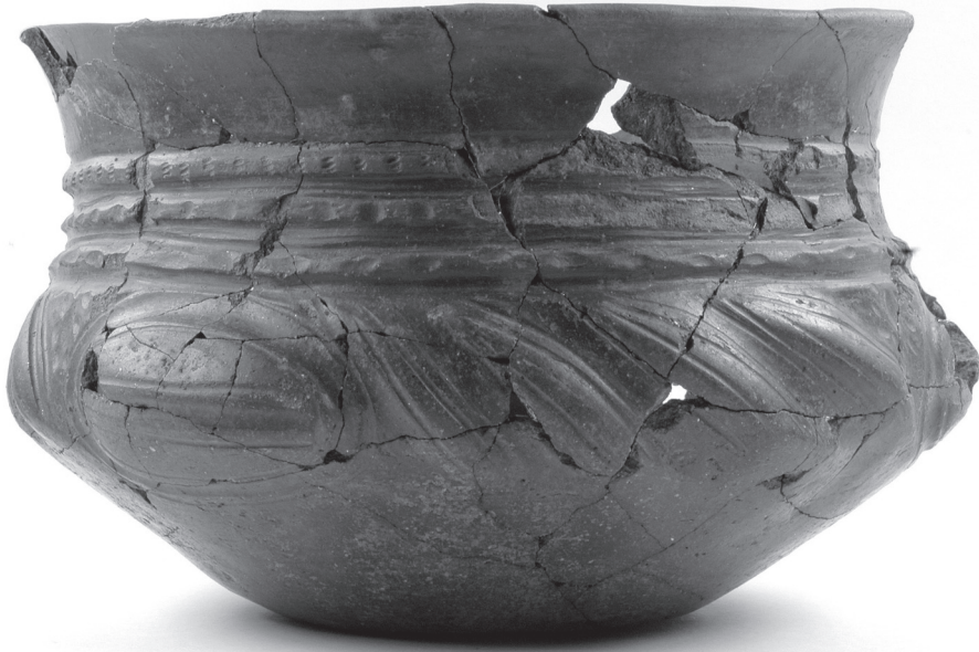
Fig. 3. Rijk versierde, Angelsaksische urn, afkomstig uit een crematiegraf op de Drentse akker (werkput D10, spoor 3). Doorsnede 'buik' ca. 25 cm.

der een met ribben versierde ring-fibula. De datering van het graf sluit aan bij de iets latere crematies met urn. Van twee crematies is de urn opgegraven. In één geval gaat het om een rijk gedecoreerde, Angelsaksische Schalurne uit de volksverhuizingstijd (fig. 3). De andere urn is enigszins biconisch, onversierd en kan zowel in de Laat-Romeinse periode als de volksverhuizingstijd zijn vervaardigd. De crematie uit de Schalurne is inmiddels gedateerd op 1745 \pm 35 BP, ofwel tussen 210 en 410 n.Chr. (95 % betrouwbaarheid). Deze datering lijkt aan de vroege kant en kan op typologische gronden wellicht worden aangescherpt. Naast de dateringen van de overige crematies, wachten we nog op de resultaten van het osteologische onderzoek (bepaling sexe, leeftijd en eventuele andere kenmerken van de overledene).