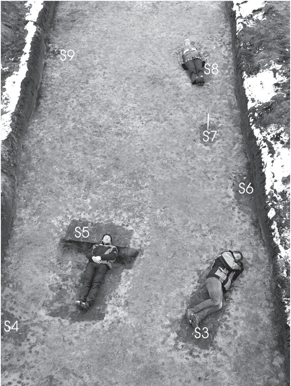
Fig. 2. Het centrale deel van een klein grafveld uit de Laat-Romeinse tijd en de volksverhuizingstijd op de Drentse akker (werkput D2). Met medewerking van Erwin Bolhuis (spoor 3), Sander Tiebackx (spoor 5) en Hilde Boon (spoor 8).