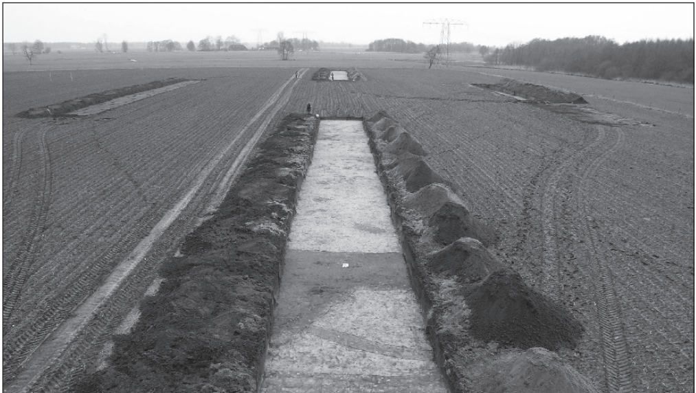
Fig. 1. Overzicht van enkele proefsleuven op de Groningse akker, gezien vanuit het zuiden.