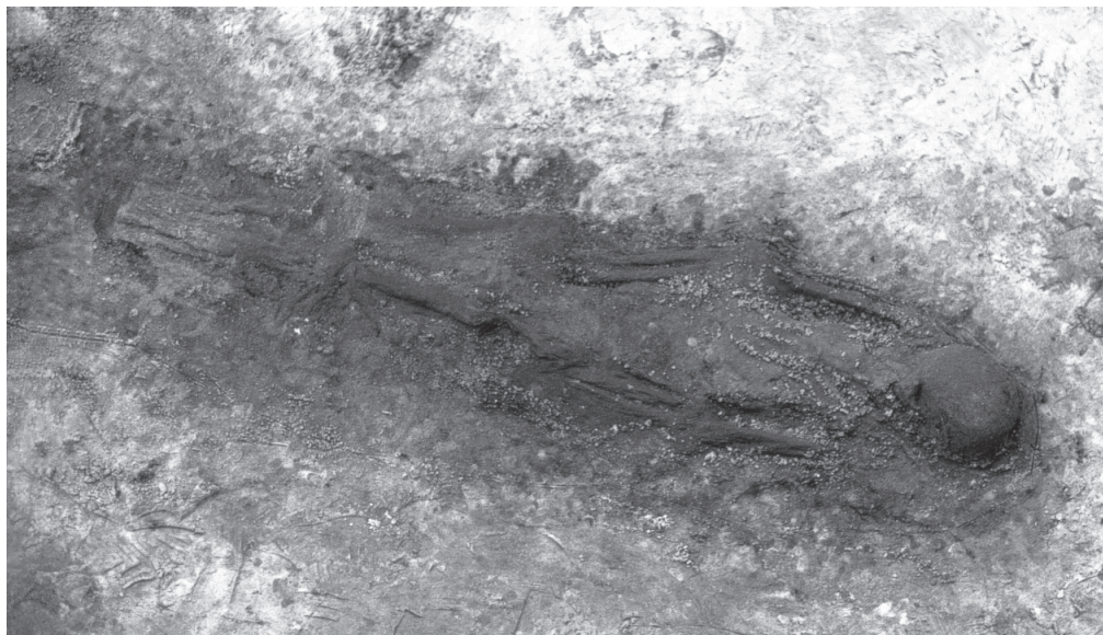
Fig.1. Menselijk skelet Swifterbant-S21. Waarschijnlijk graf 11 (archief GIA).

en snijsporen is echter moeilijk gebleken: in vele opgravingsrapporten wordt niet duidelijk welke van de twee het betreft. Hierdoor wordt het erg lastig verdere uitspraken te doen over de oorzaak of de context van de sporen. In ieder geval komen deze niet zo frequent voor dat er een fundamentele handeling aan ten grondslag lijkt te liggen.