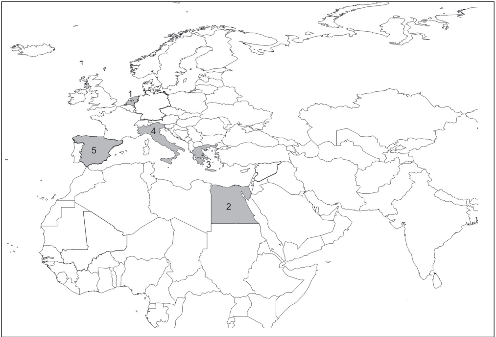
In dit nummer: 1) Nederland, 2) Egypte, 3) Griekenland, 4) Italië, 5) Spanje.