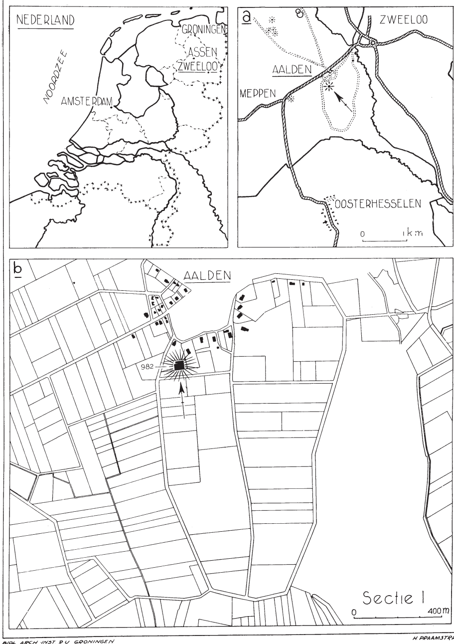
Fig. 1. De originele locatietekeningen, inzoomend op de Hoge Hof. De dorpskom van Aalden is weggelaten (tek. H. Praamstra, voormalig BAI).