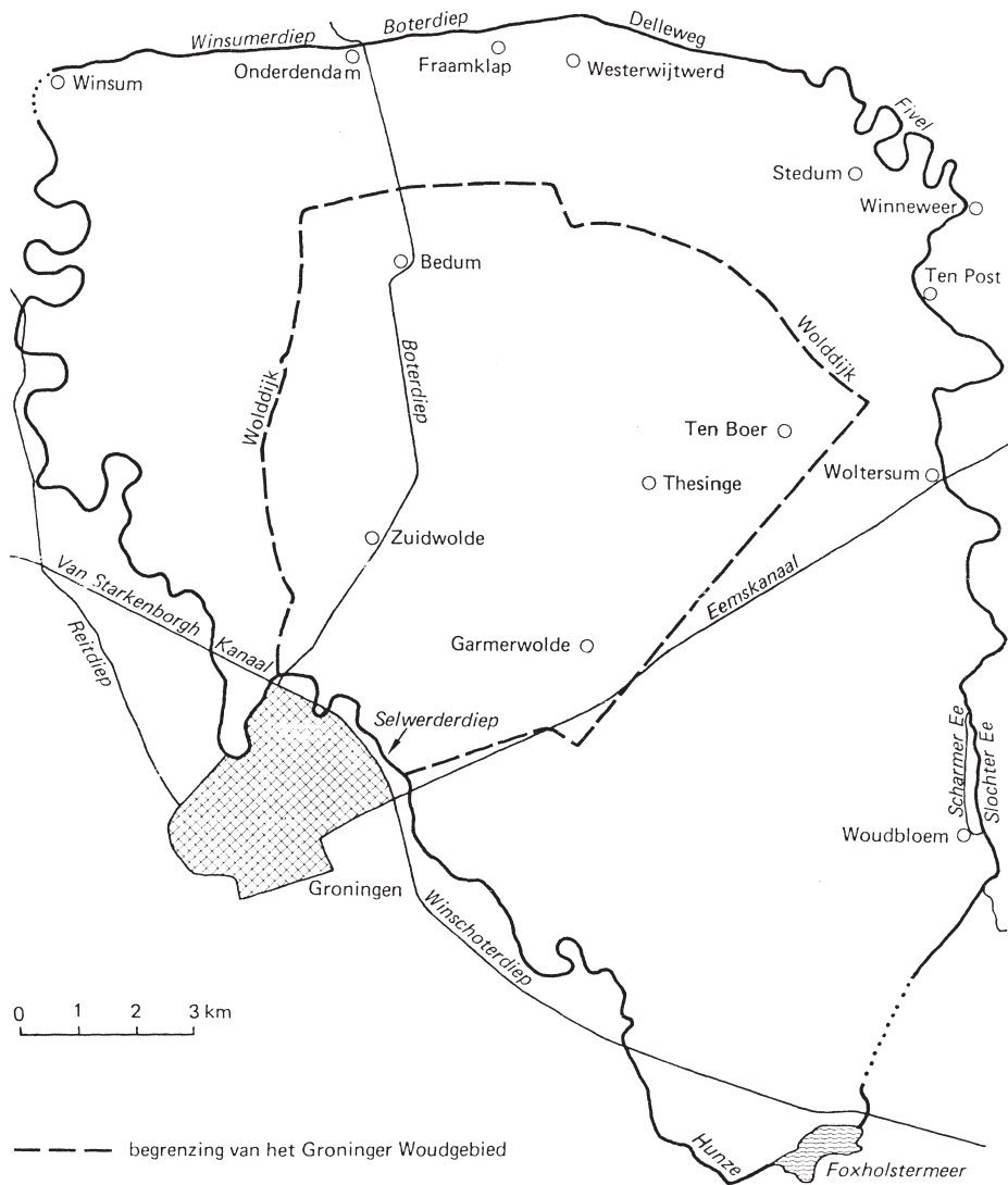
Fig. 1. Het studiegebied binnen de Wolddijk (Clिंगeborg, 1981: 185).

maar dit verschilt per gebied. Hij gaat uit van Duitsland waar vooral de 14 e en in mindere mate de 15 e eeuw als belangrijkste eeuwen van de Wüstungs -vorming worden gezien. In Engeland ligt de Wüstungs -periode later en daar geldt dat de grootste ontvolking van het platteland (en daarmee het ontstaan van deserted medieval villages ) pas plaatsvond na cir-