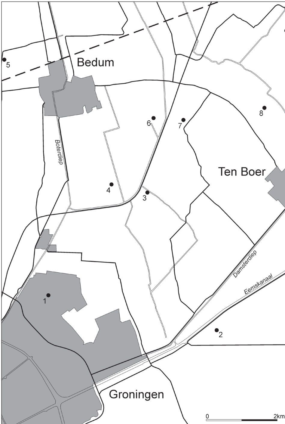
Fig. 2. De Wüstungen in het Woudgebied: 1. Beijum; 2. Heidenschap; 3. Steerwolde; 4. Ellerhuizen; 5. Westerdijkshorn; 6. Oostbedumerwolde; 7. Emerderwolde; 8. Hemerderwolde (kaart S. Tiebackx, GIA).