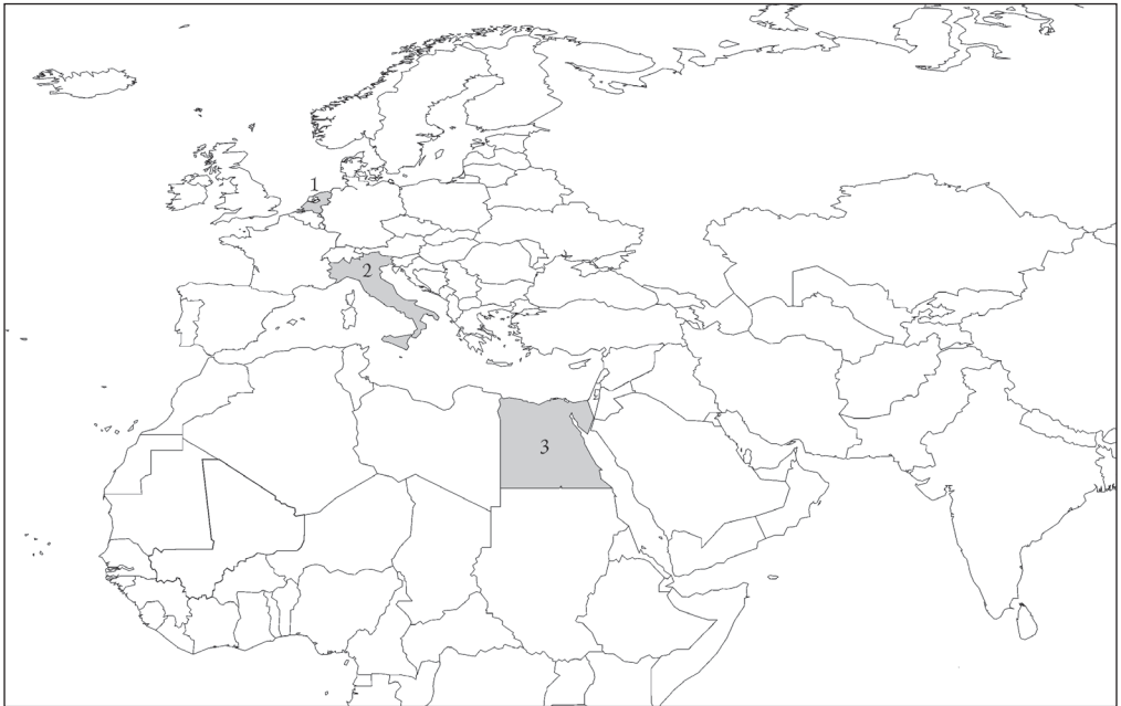
In dit nummer: 1) Nederland, 2) Italië, 3) Egypte.