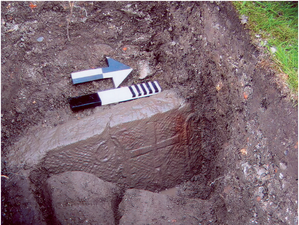
Fig. 3. Detail van de decoratie aan de binnenkant van sarcofaag 2 (foto M.J.M. de Wit, ARC bv).

sarcophagus lid, were found in the churchyard of the Sinte Margriet church at Boksum, in the province of Friesland. Three of these were (and still are) in situ and could be properly investigated by archaeologists. The fourth one, unfortunately, could not, though it has been restored and is nowadays on display inside the church. The sarcophagi and the lids of the cists are made of red sandstone and originate from the Middle Rhine area, which from about 1000 to 1300, saw a flourishing industry in the production of sandstone sarcophagi. Since the 11 th century, these sarcophagi found their way to the coastal areas of Denmark, Germany and the northern Netherlands, where they were used and re-used for centuries. As a rule, the people buried in these often finely decorated sarcophagi belonged to the local elite or clergy. The importance of the finds at Boksum lies both in the number of the