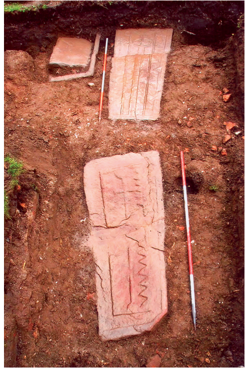
Fig. 2. Sarcofaag 2 en de steenkisten in het vlak.

De sarcofagen en steenkisten van Boksum kunnen niet exact worden gedateerd. De steenkisten zijn ingegraven in een terplaag die door middel van aardewerk is gedateerd in de late Middeleeuwen A (11 e /12 e eeuw). De steenkisten zelf kunnen gedateerd worden in het begin van de 13 e eeuw of later. De oorspronkelijke tufstenen Sinte Margriet is aan het begin