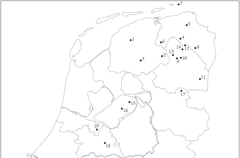
In dit nummer: 1) Boksum, 2) Fochteloo, 3) Heerenveen, 4) Haren, 5) Lellens, 6) Marum, 7) Rottumeroog, 8) Wildervank, 9) Assen, 10) Balloo, 11) Emmerschans, 12) Plankensloot, 13) Zeijen, 14) Zuidlaren, 15) Dronten, 16) U34, Oost-Flevoland, 17) De Krim, 18) Leusderheide, 19) Aardjesberg.