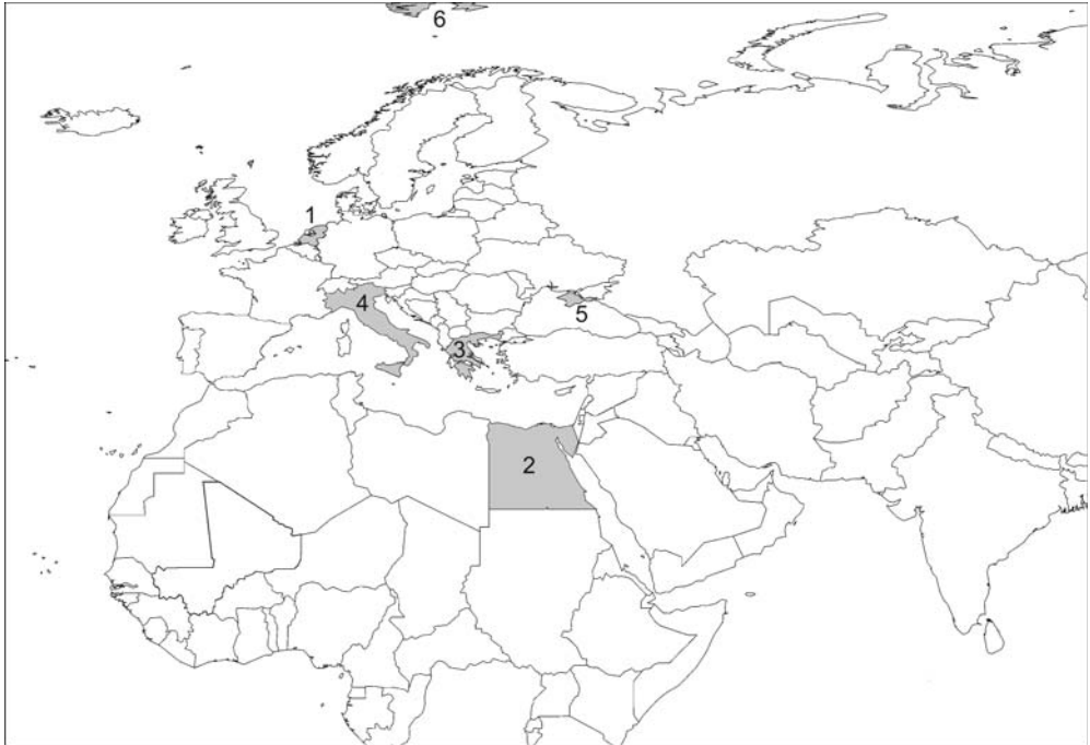
In dit nummer: 1) Nederland, 2) Egypte, 3) Griekenland, 4) Italië, 5) De Krim, 6) Spitsbergen