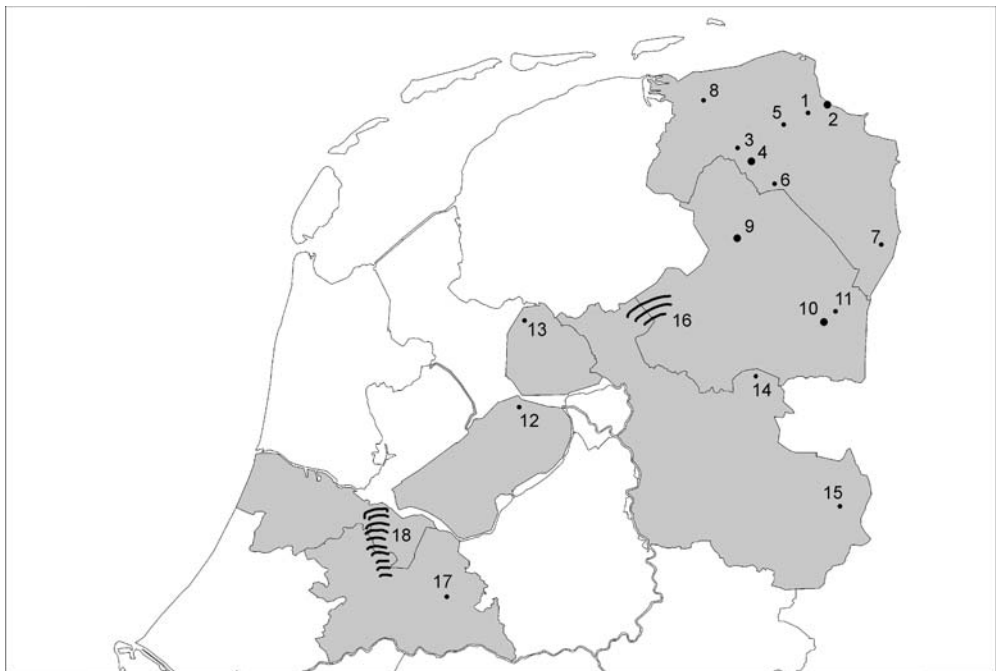
In dit nummer: 1) Appingedam, 2) Delfzijl, 3) Dorkwerd, 4) Groningen, 5) Kroddeburen, 6) Noorderlaren, 7) Sellinger, 8) Warfhuizen, 9) Assen, 10) Emmen, 11) Emmerschans, 12) Swifterbant, 13) Oost-Flevoland, lokatie B36, 14) De Krim, 15) Rossum, 16) Steenwijkgebied, 17) Leusderheide, 18) Vechtgebied