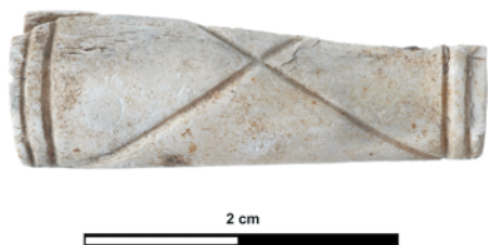
Fig. 2. Benen knoop uit dubbelgraf.

resten van het dubbelgraf en is te associëren met het jonge kind dat hier is begraven. Dit graf wordt gedateerd in de late bronstijd ( 2975 \pm 30 BP). De knoop is vervaardigd uit de schacht van een radius (spaaakbeen) van waarschijnlijk schaap. Aan de 'bovenzijde' is de knoop versierd met twee verticale kraslijnen aan de uiteinden, en daartussen twee kraslijnen in de vorm van een kruis. De knoop is meeverbrand op de brandstapel en daardoor wit verkleurd, iets vervormd en incompleet.