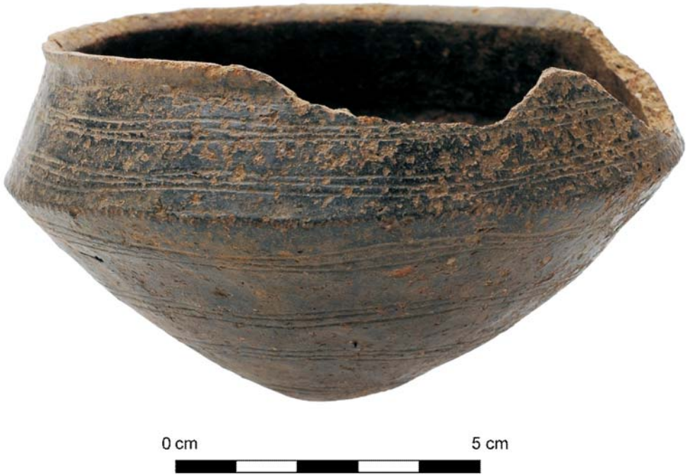
Fig. 3. Bijpotje, geïnspireerd op bronzen vaatwerk.

is, vlak boven de grootste buikomvang, versierd met een plastische cordon, met vingeropdrukken. Deze cordon is duidelijk naderhand aangebracht. Op deze urn was een pot met een tweemaal scherp verticaal doorboorde, lipvormig handvat geplaatst, daterend uit de vroege ijzertijd. Het is opvallend dat de onderzone van deze pot volledig is verbrand, waarbij het aardewerk door en door is geoxideerd en verpoederd, terwijl de rand en schouder weliswaar aan de buitenzijde oxiderend zijn gebakken, maar niet de karakteristieke orangerode kleur hebben van verbrande scherven. Een verklaring voor dit verschijnsel zou kunnen zijn dat de pot (met eventuele inhoud) rechtop is bijgezet bij de brandstapel en dat alleen de onderkant met het vuur in contact is gekomen.