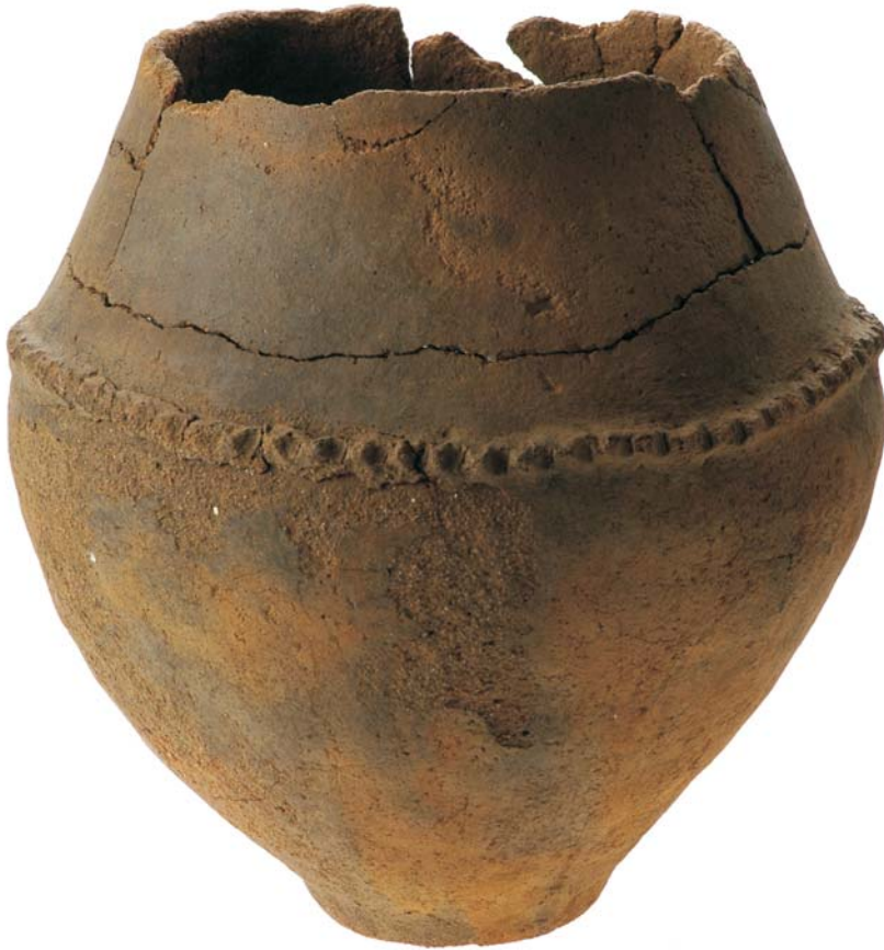
Fig. 4. Urn met cordonversiering.

liggen. De spiekers in het onderzoeksgebied zijn alle vierpalig. Mogelijk hebben ze deel uitgemaakt van het erf van het huis waarvan in de uiterste noordwesthoek van het onderzoeksgebied een deel van de plattegrond is gevonden. Hier is de oostelijke helft van een gebouw aangetroffen. Het betreft een oost-west gelegen, drieschepig huis. De totale breedte van het gebouw is 7 m.