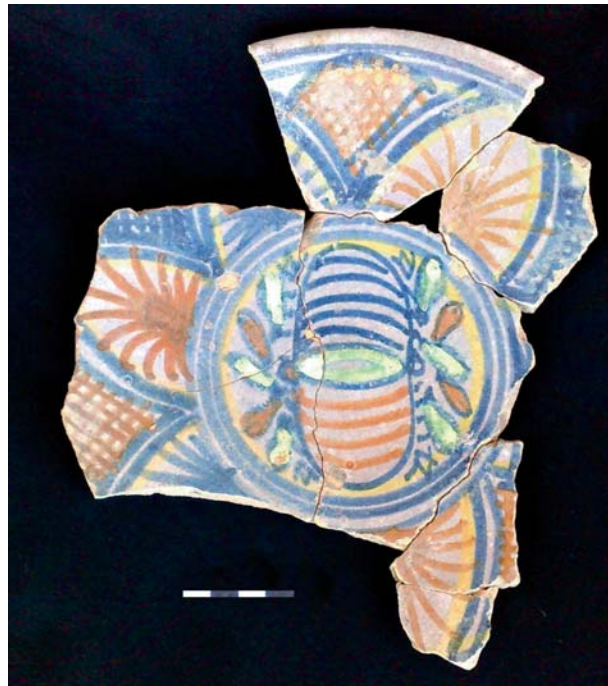
Fig. 3. Een bord met granaatappel (m-bor-5).

Allereerst zijn er zo'n 70 tinglazuurtegels opgegraven. Helaas konden ook hier door fragmentatie geen complete afmetingen worden bepaald. Tevens zijn slechts kleine stukjes van de vooral blauwe en soms paarse decors bewaard. Op drie tegels zijn enkel nog de dubbele cirkels zichtbaar, waarin traditiegetrouw