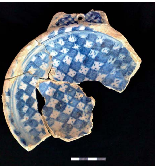
Fig. 4. Een papkrom met schaakborddecor (m-kom-4, zie fig 2.11).