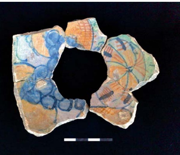
Fig. 5. Een kombodem met fruitdecor (m-kom).

een voorstelling werd geplaatst. Tot één van die voorstellingen behoort een figuur met een hoge hoed onder een wolkenhemel. Op andere