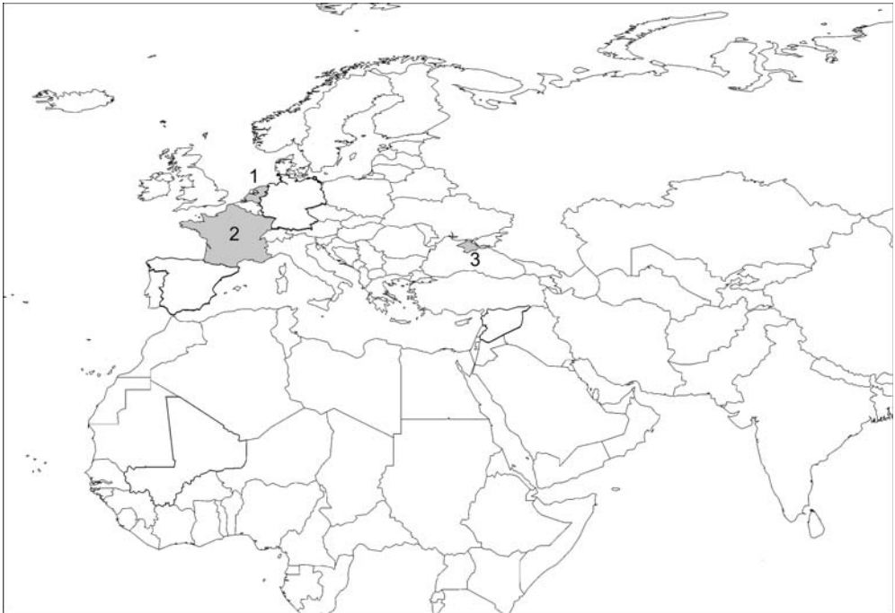
In dit nummer: 1) Nederland, 2) Frankrijk, 3) De Krim, Oekraïne