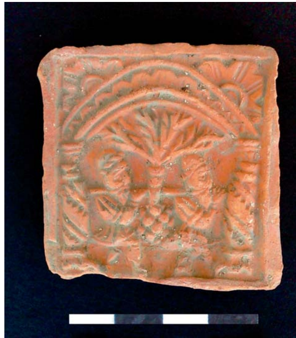
Fig. 1. Een reliëftegel met Bijbels decor. Afm: 5.1x5.0x0.6-0.8 cm.

De resterende overweldigende hoeveelheid