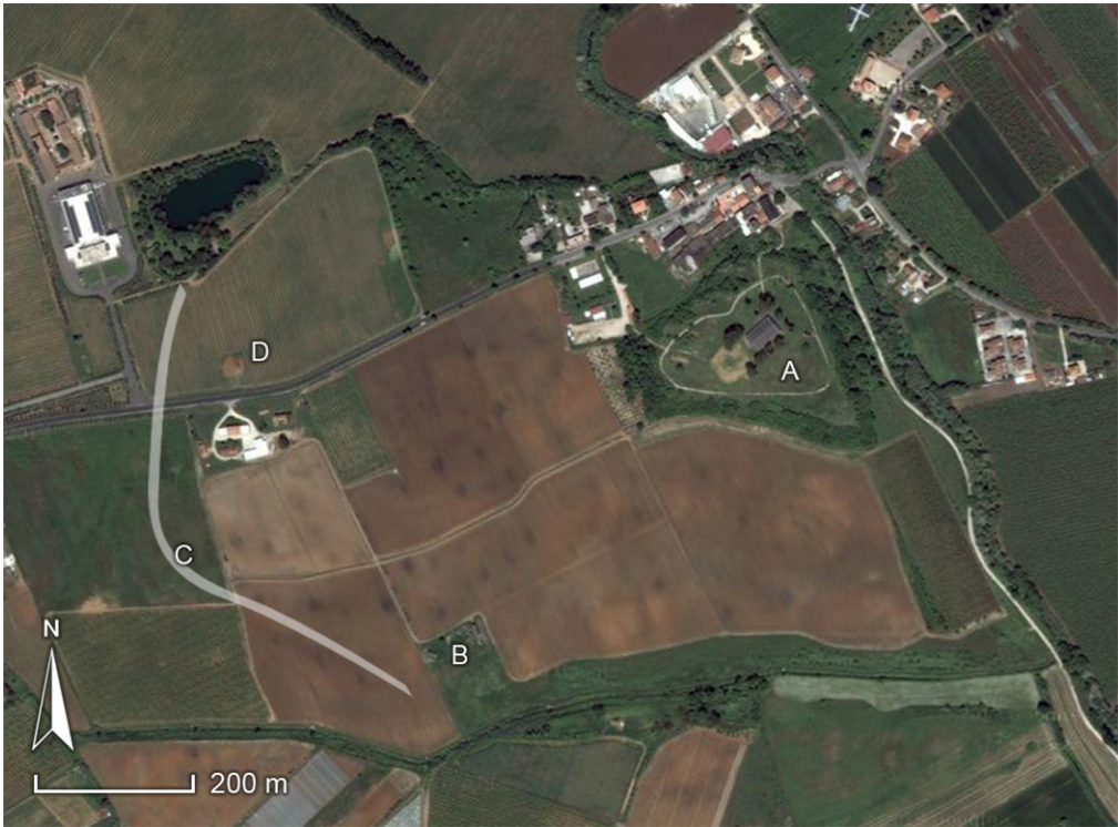
Fig. 1. Le Ferriere en omgeving met een aantal archeologische locaties: A = akropolis; B = zuidwest necropool; C = agger; D = archaïsche straat met bebouwing en graven.

een beeld worden geschetst van de culturele context van Satricum en vervolgens zal een beknopt overzicht worden gegeven van de belangrijkste resultaten die het onderzoek van de RUG heeft opgeleverd.