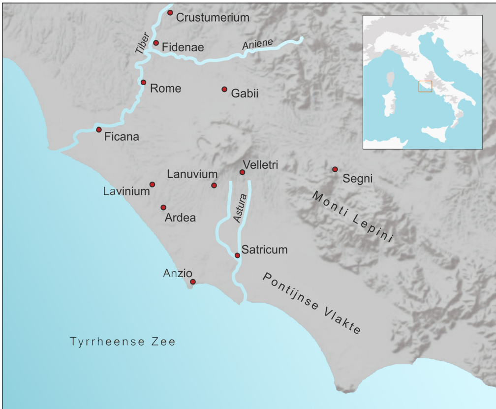
Fig. 2. Kaart met in dit artikel genoemde sites in Latium vetus (Tek. W. de Neef, RUG/GIA).

De eerste archeologische tekenen van stedelijke architectuur zijn herkend in Latium vetus tegen het einde van de 7 e eeuw v. Chr. In plaats van eenvoudige hutten worden huizen gebouwd op stenen fundamenteën met daken die met terracotta dakpannen zijn bedekt. Deze huizen zijn aangetroffen in versterkte centra, die proto-urbaan worden genoemd omdat ze al enige stedelijke kenmerken vertonen. Zo zijn de contouren van deze nederzittingsgebieden herkenbaar in het landschap omdat zij zijn versterkt ofwel gebruikmakend van de natuurlijke mogelijkheden, zoals hellingen, of door de aanleg van verdedigingsconstructies in de vorm van aarden wallen ( aggeres ). Deze nederzittingsgebieden werden doorsneden door doorgaande