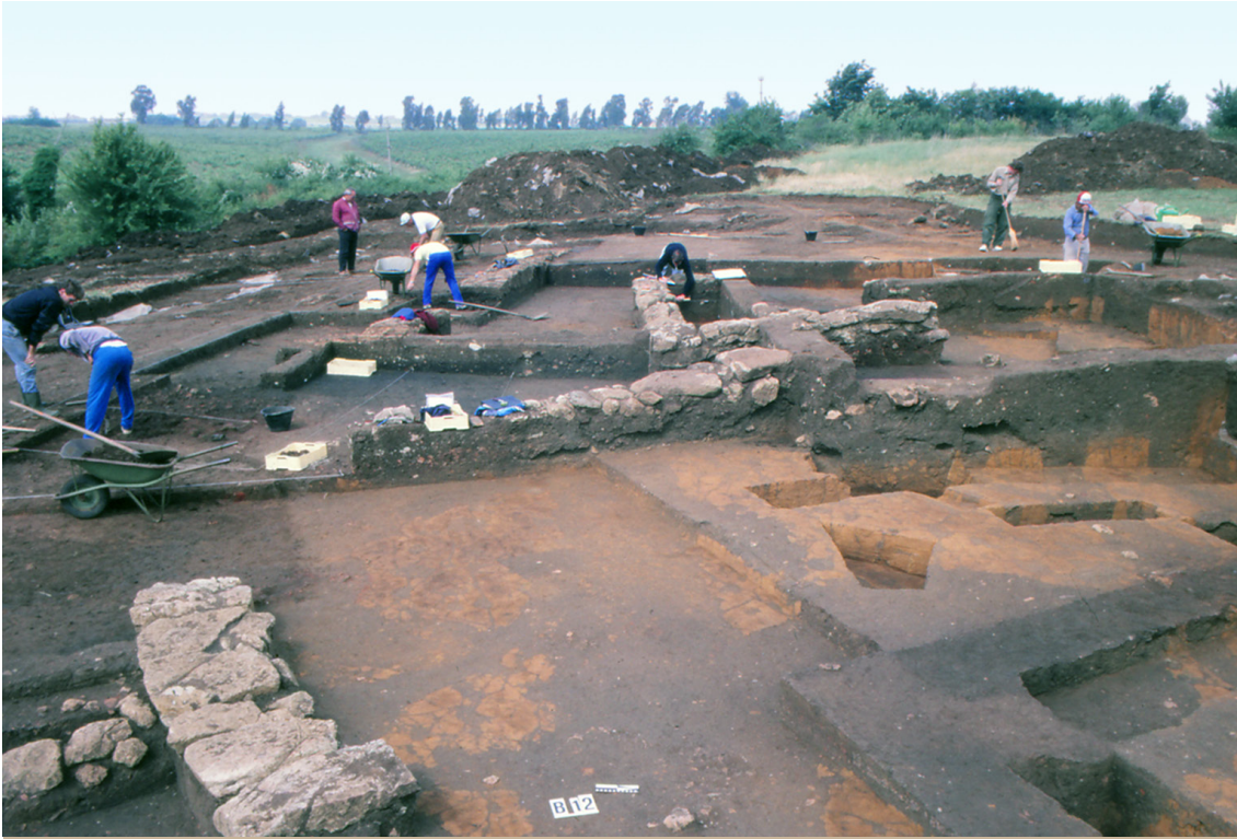
Fig. 4. Satricum, tijdens de opgraving in 1985.

voor de klassiek geschoolde archeologen relatief nieuw en onder leiding van professor Marianne Maaskant-Kleibrink werd een traditie gevestigd. 8 Bij het toenmalige BAI (Biologisch Archeologisch Instituut, Groningen) werd aangeklopt voor adviezen en van de daar aanwezige expertise werd dankbaar gebruik gemaakt. In eerste instantie waren de voornaamste doelen om aansluiting te vinden bij de opgraving uit de 19 e eeuw en tegelijk vertrouwd te raken met de grond. Een ogenschijnlijke wirwar van tracés van fundamenteën werd aangetroffen. Direct onder deze stenen ‘verschenen’ de verkleuringen, grotere (hutkuilen) en kleinere (kookkuilen, paalgaten). De overgang van hut naar huis kwam in beeld!