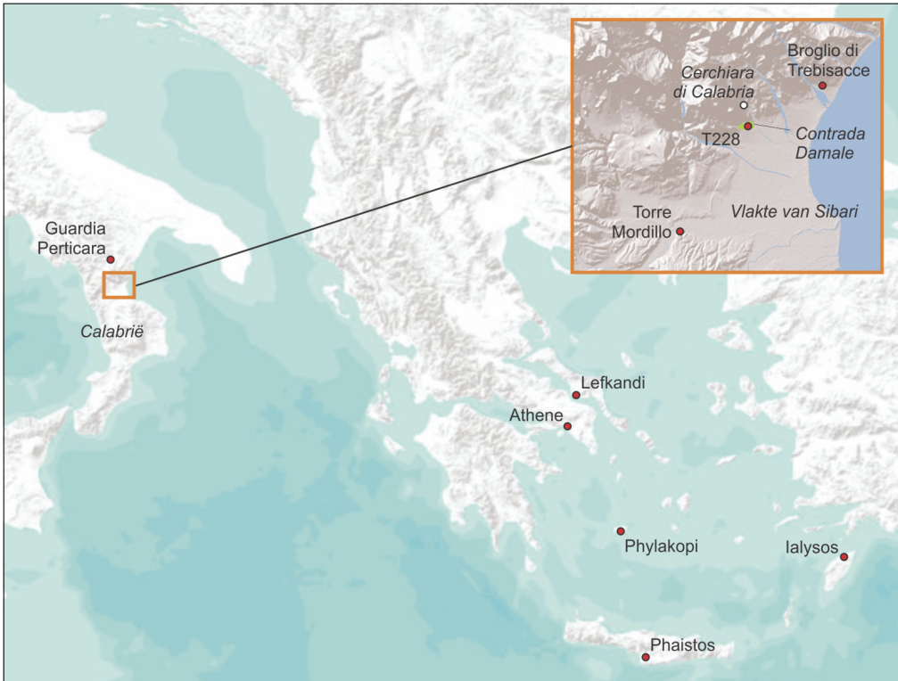
Fig. 2. Kaart van Zuid-Italië en Griekenland met de vindplaatsen genoemd in de tekst. In de inzet de Vlakte van Sibari (Calabrië) met de vindplaatsen T228, Broglio di Trebisacce en Torre Mordillo (W. de Neef, RuG/GIA).

voorwerp gedateerd worden in de laatste fase van de Bronstijd (de 10 e eeuw v.Chr.).