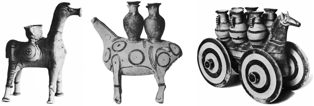
Fig. 5. Griekse paardenbeeldjes. Van links naar rechts: Mykeens paard uit een graf in Ialysos, 12e eeuw v. Chr. (Higgins 1967, plaat 5B); paard uit een 8e eeuwse kindergraf op de Kerameikos, Athene (Kübler 1954, plaat 144) en een 8e eeuwse Euboïsch exemplaar (Boardman 1957, plaat 3).

Pas vanaf de 8 e eeuw v. Chr. komt in Griekenland het gecombineerde type voor van paard met potten op de rug en gaten in de benen voor wieltjes. In een 8 e eeuwse graf op de begraafplaats de Kerameikos in Athene is een lang dier met vijf amforen en een ruiter gevonden. De vier benen van het dier hadden gaten voor wieltjes; gaten in de hand van de ruiter en de neus van het paard waren waarschijnlijk voor teugels. Een ander exemplaar uit een kindergraf op de Kerameikos beeldt een dik paard uit beschilderd met cirkels, vier amforen op de rug, en gaten in de vier benen (fig. 5, midden). Een ander voorbeeld is bekend uit een 8 e eeuwse graf in Lefkandi, waarschijnlijk een geïmporteerd protogeometrisch exemplaar uit Attica met twee potten op de rug.