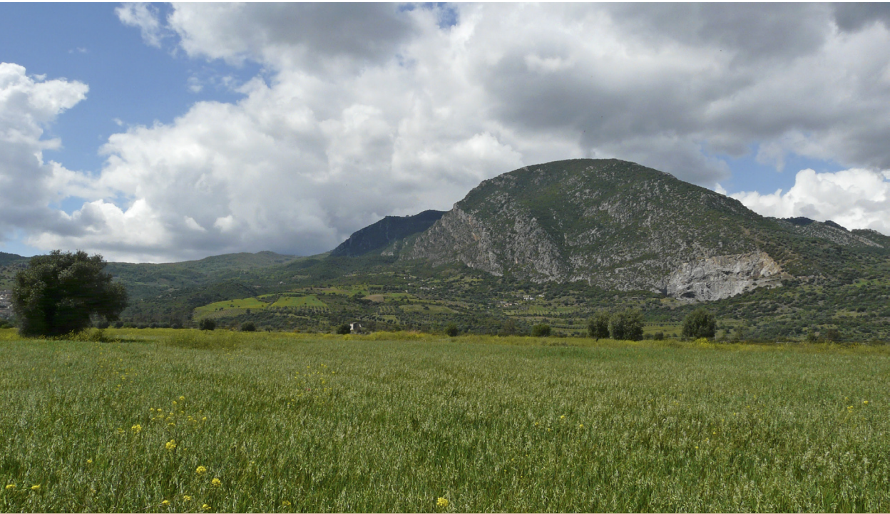
Fig. 1. Het GIA-onderzoekgebied in de Contrada Damale, gelegen aan de voet van de berg Serra del Gufo.

Bronstijd, maar het zou ook een sub-recente basis voor het terras kunnen zijn.