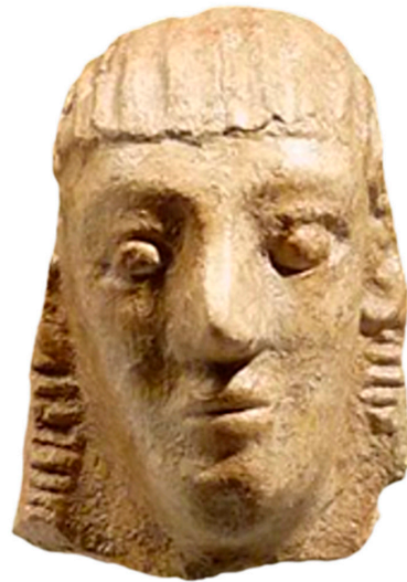
Fig. 2. Terracotta hoofd uit de late 7de eeuw v.Chr. uit de kunsthandel, verhandeld in 2012.

daadwerkelijk uit Francavilla Marittima stamt. Zolang er geen vergelijkbare terracotta hoofden aan het licht komen op andere archeologische sites, is waarschijnlijk dat het hoofd uit de kunsthandel eveneens uit Francavilla stamt. Doordat het nieuwe fragment heel is geeft het in ieder geval meer informatie, waardoor het in de toekomst wellicht te verbinden is aan een bijbehorend lichaam. Zo had een fragment mét hoofd uit Francavilla Marittima (fig. 4), dat zich in een catalogus van een galerie in New York met de naam 'Atlantis Antiquities' bevond, eveneens een meerwaarde voor het onderzoek naar de terracotta's uit Francavilla Marittima, omdat met behulp hiervan het type van de voor Francavilla unieke Athena Erganè kon worden gereconstrueerd 3 .