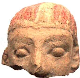
Fig. 3. Half terracotta hoofd uit Francavilla Marittima, nog ongepubliceerd.