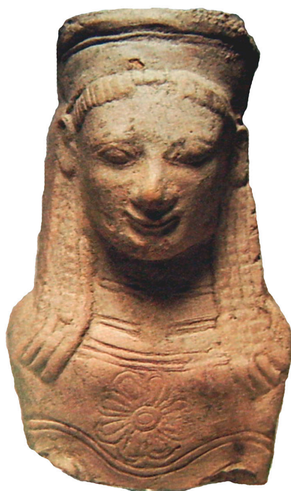
Fig. 4. Terracotta fragment van Athena Ergane uit Francavilla Marittima uit een catalogus van Atlantis Antiquities in New York.

Het eerst gepubliceerde exemplaar van deze 'Theseus en Ariadne' pinax bevindt zich in een privéverzameling in Bonn (Borda, 1979: 78). Het is rond 1927 aangekocht van een Levantijnse kunsthandelaar, ene Alfandaris,