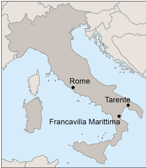
Fig. 1. Locatie van Francavilla Marittima en Tarente.