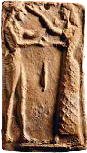
Fig. 5. Terracotta pinax met voorstelling van Theseus en Ariadne en/of een heilig huwelijk uit de late 7de eeuw v.Chr. uit de kunsthandel, verhandeld in 2012.

Hoewel Tarente vanaf de 5 e eeuw v.Chr. een bloeiende terracotta productie kende (Lippolis, 1997) is er weinig bewijs voor een omvangrijke productie in de 7 e en 6 e eeuw v.Chr. Het al veel geciteerde boek van Borda uit 1979, Arte dedalica a Taranto , wordt - nog steeds - beschouwd als de belangrijkste documentatie voor een 7 e eeuwse Tarentijnse productie. Zorgvuldig napluizen ervan leert echter dat de herkomst van de 16 typen die hij bespreekt - vaak vertegenwoordigd door slechts één fragment of exemplaar - doorgaans onzeker is. Slechts één fragment werd daadwerkelijk in Tarente gevonden (Borda, 1979: 32, nr. 3) en vier in het nabij gelegen Satyrion (Borda, 1979: 39, nr. 6, 59, nr. 11, 67, nr. 15, 69, nr. 16). De andere stukken zijn op basis van een voor Tarente kenmerkend geachte stijl, techniek en klei, ontleend aan de Theseus en Ariadne pinax in Bonn, toegeschreven aan Tarente. De herkomst daarvan was echter ook al een toeschrijving zonder enige verbinding met archeologische data. Bovendien komt één van de vijf typen met zekere herkomst (Borda, 1979: 59-60,