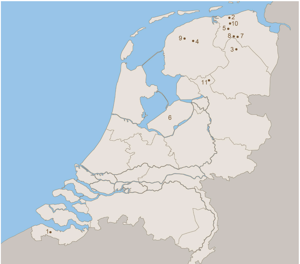
In dit nummer: 1) Biervliet, 2) De Wierhuizen, 3) Donderen, 4) Eernewoude, 5) Ezinge, 6) Flevoland, 7) Groningen, 8) Hoogkerk, 9) Leeuwarden, 10) Mensingeweer en 11) Steenwijk