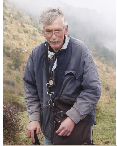
Veldwerk 2006 in Calabrië, Italië.