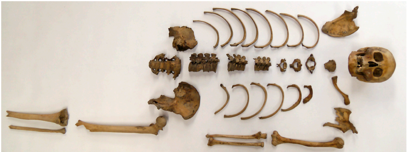
Fig. 3. De verzamelde delen van het skelet van de terp Hizzard.

het terpengebied vaak nogal afwijken van waarden die in het binnenland worden gemeten. In het binnenland is een waarde van 5-8‰ de normale marge, maar de waarden van skeletmateriaal uit het terpengebied liggen aanzienlijk hoger. De \delta^{13}\text{C} waarden zijn echter gelijk aan die van mensen met een binnenlands voedselpatroon. Dat geldt overigens niet alleen voor alleseters zoals mensen, maar ook voor planteneters zoals runderen (Nieuwhof 2015: 241-243). Dat betekent dat de hoge \delta^{15}\text{N} waarden niet worden veroorzaakt door visconsumptie. Waarschijnlijk is een afwijkende stikstofcyclus in het kweldermilieu de oorzaak van de hoge \delta^{15}\text{N} waarden die worden gemeten in de skeletten van kwelderbewoners (Britton et al. 2008). Aan de hand van de afwijkende \delta^{15}\text{N} waarden kunnen mensen die hun hele leven (of in elk geval al vele jaren) hebben gewoond in het terpengebied worden onderscheiden van mensen die uit het binnenland afkomstig zijn.