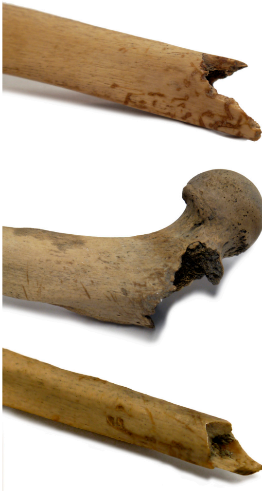
Fig. 4. Voorbeelden van vraatsporen. Boven: de onderzijde van het linker scheenbeen. Midden: de bovenzijde van het linker bovenbeen. Onder: de onderzijde van het linker kuitbeen.

skelet is namelijk opvallend fijngebouwd voor een man en vertoont ook meerdere kenmerken op het bot die vrouwelijk aandoen. Een onderzoek naar het sluiten van de schedelnaden en de ontwikkeling en degradatie van twee articulatievlakken op de heupen (de symphyse op de pubis ofwel schaambeentjes, en het auriculare oppervlak op het ilium , ofwel darmbeen) wijst uit dat deze vermoedelijke man een leeftijd van 40 \pm 10 jaar heeft bereikt. De lichaamslengte is geschat op ongeveer 1 \text{ m. } 65 \pm 10 .