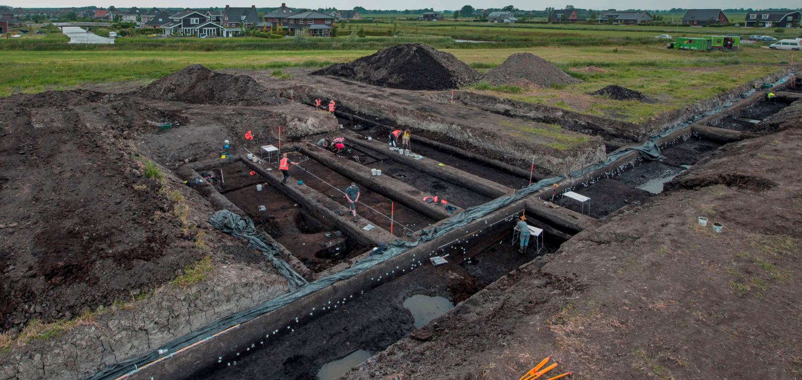
Fig. 2. Overzichtsfoto van de opgraving.

vermoede oudste bewoningskern zou overlappen. De grote lengte van deze werkput was noodzakelijk om ook de sporen van het voormalige cultuurlandschap rondom de vroegere nederzetting te kunnen onderzoeken. De positie van de meest noordelijke van de oude ARC-sleuven lag enkele meters naar het oosten en zou werkput 1 niet verstoren. Later is nog een kleine dwarsleuf vanuit werkput 1 aangelegd om de ARC-sleuf aan te snijden opdat beide opgravingen stratigrafisch aan elkaar gekoppeld kunnen worden.