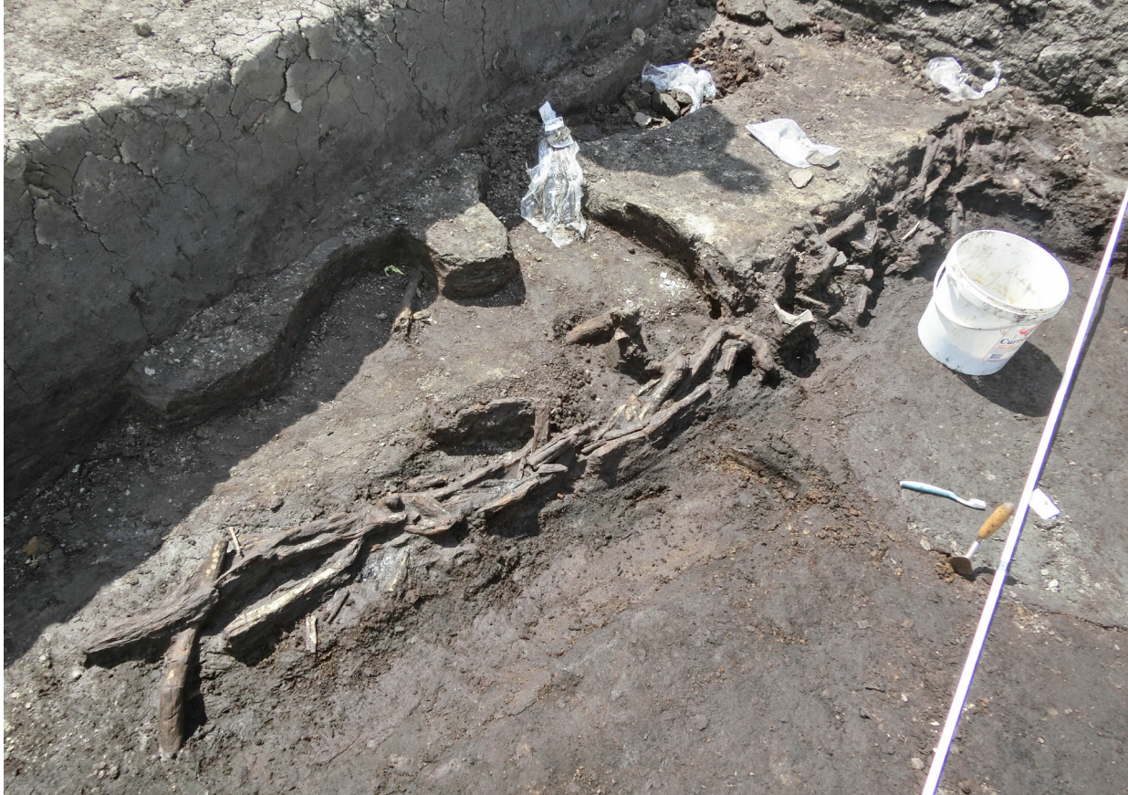
Fig. 3. Het blootgelegde vlechtwerk in werkput 6.

dateren. Tussen de verschillende werkputten zijn daarom overal een meter brede dammen intact gelaten zodat er veel profielen konden worden gedocumenteerd. Verder zijn in werkput 1 drie tussendammen van elk 1 m breed intact gelaten voor de documentatie van zijprofielen. Om het beeld compleet te maken zijn aan het einde van de opgraving delen van de tussenliggende dammen op veel plekken doorbroken. Op deze manier konden de profielen van de verschillende werkputten aan elkaar gekoppeld worden.