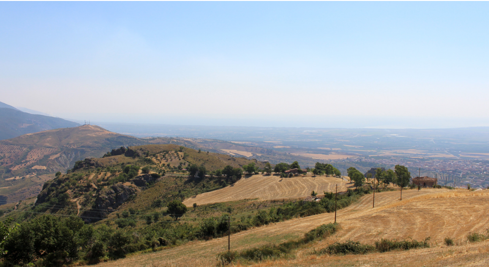
Fig. 2. De Monte San Nicola (links) vanuit het westen. De radiotoren op de top is zichtbaar. Uiterst rechts het plaatsje Lauropoli, in de achtergrond de vlakte van Sibari en de Ionische Golf.