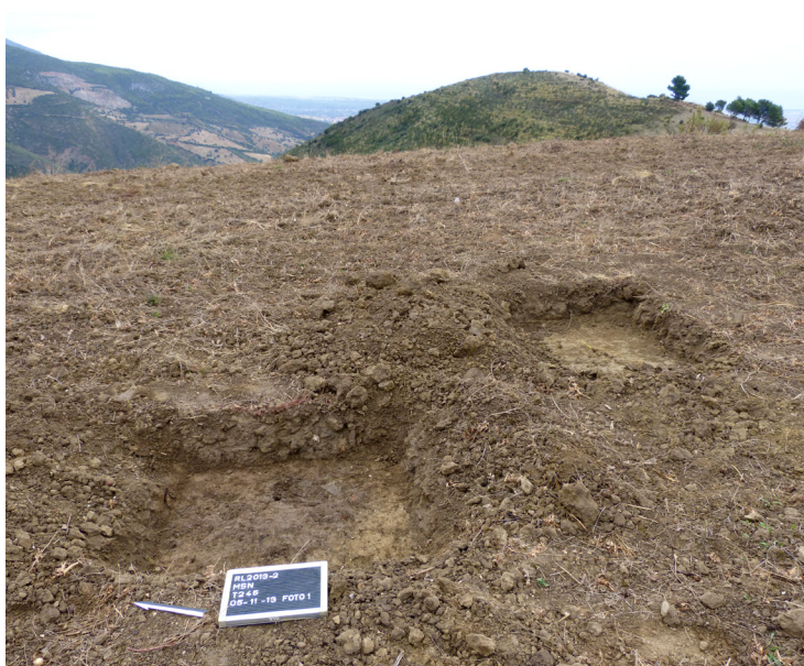
Fig. 8. Op zoek naar de oorzaak van een ronde magnetische anomalie op de noordflank van Monte San Nicola. In het linkervak is een donkere, ronde verkleuring zichtbaar direct onder de ploeglaag (vindplaats RB245a). Rechts: detail van spoor RB245a. Locaties van aardewerkfragmenten zijn omlijnd met witte stippellijnen.