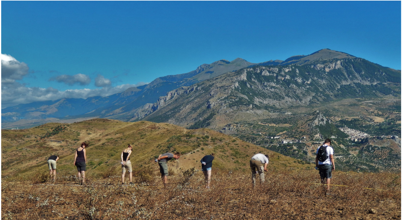
Fig. 6. Studenten en medewerkers van het GIA voeren een archeologische survey uit op de noordflank van de Monte San Nicola. Op de achtergrond het Pollino-massief en rechts het dorpje Cività.

noord- en zuidhelling opnieuw archeologisch gesurveyd (fig. 6). Deze nieuwe kartering was noodzakelijk omdat de voorgaande surveys niet het hele geofysisch onderzochte gebied besloegen, of door vegetatie niet systematisch waren uitgevoerd. Bovendien was de plaatsbepaling van de RAP-surveys, op basis van mobiele GPS en veldschetsen, niet nauwkeurig genoeg om de ruimtelijke relatie tussen oppervlakteconcentraties en de nieuw ontdekte geofysische anomalieën te bepalen. In twee zones waarin de ronde anomalieën gekarteerd waren, werden alle oppervlaktevondsten daarom zelfs apart ingemeten met de Total Station. Deze hoge karteringsresolutie, waarbij we van elke vondst weten waar hij gevonden is en tot welke vondstcategorie hij behoort, is uniek in Mediterrane landschapsarcheologie en biedt ons een uitgelezen methodologisch instrument om resten op en onder het oppervlak te kunnen vergelijken.