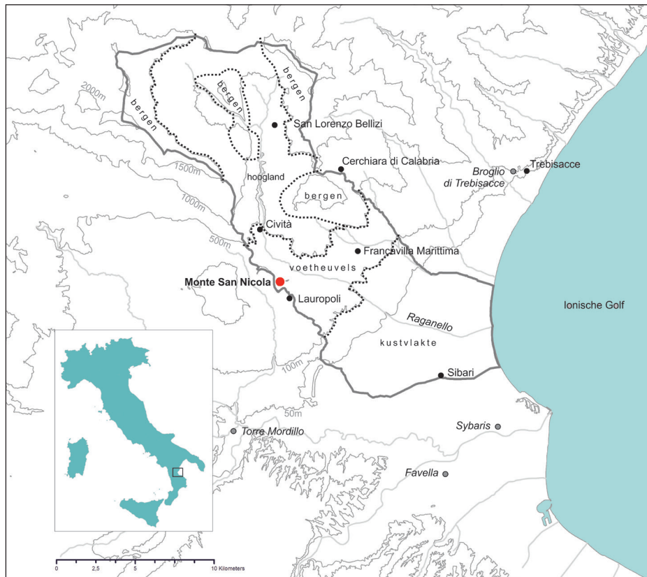
Fig. 1. Locatie van de Monte San Nicola in de regio Sibaritide. Het GIA-onderzoekgebied is aangegeven met een grijze lijn; dorpen met een zwarte stip; archeologische vindplaatsen met een grijze stip. De landschapszones in het onderzoekgebied zijn begrensd met stippellijnen.

voor een interpretatie. Tijdens het Rural Life in Protohistoric Italy project (2010-2015) heeft de auteur met gedetailleerd interdisciplinair onderzoek meer informatie over het protohistorische gebruik van de heuvel verzameld. De combinatie van archeologische, geofysische en bodemkundige datasets levert een verrassende nieuwe interpretatie op. In dit artikel worden de verschillende onderzoeksstappen gevolgd die hiertoe geleid hebben.