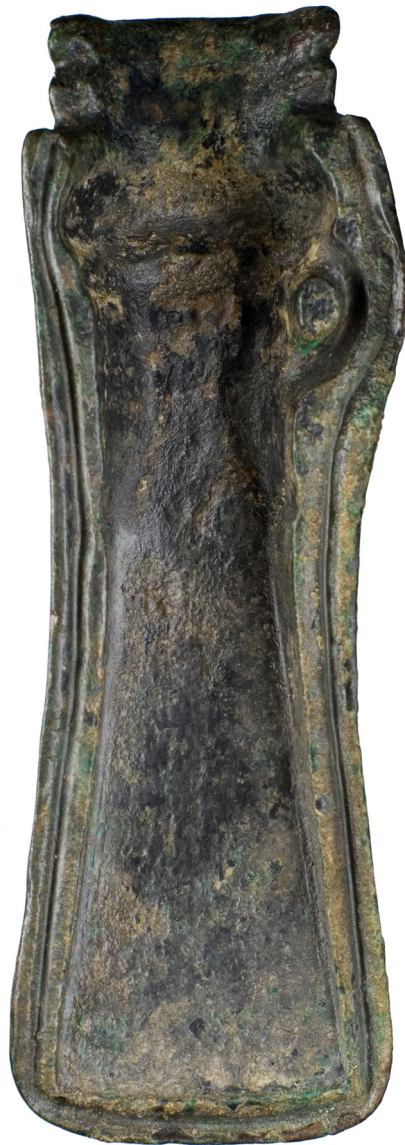
Fig. 4. De binnenkant van de halve gietmal op ware grootte. Lengte 15,5 cm, breedte 5 cm, dikte 2,5 cm. Collectie: Het Noordbrabants Museum, 's-Hertogenbosch.

verteld had en voegde er nog aan toe dat hij al vanaf 1820 bronzen uit Amiens en omgeving verzamelde. Pas later kregen geleerden daar belangstelling voor (Breuil 1903:505).