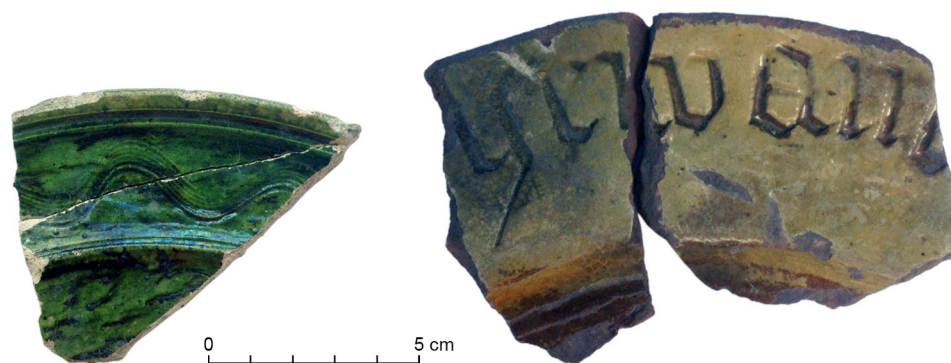
Fig. 2. Links: Fragment van een prestigieus groen-geglazuurd bord, vermoedelijk uit Keulen. Rechts: Fragment van het bord met gotische letters. Datering eind of post-kloosterperiode.

interpretatie van het materiaal de context waarin het gevonden wordt in ogenschouw moeten worden genomen. Als de kloosterlingen vonden dat hun aardewerk binnen de kloosterregels paste, wat zegt dat dan over hun perceptie van het soberheidsideaal?