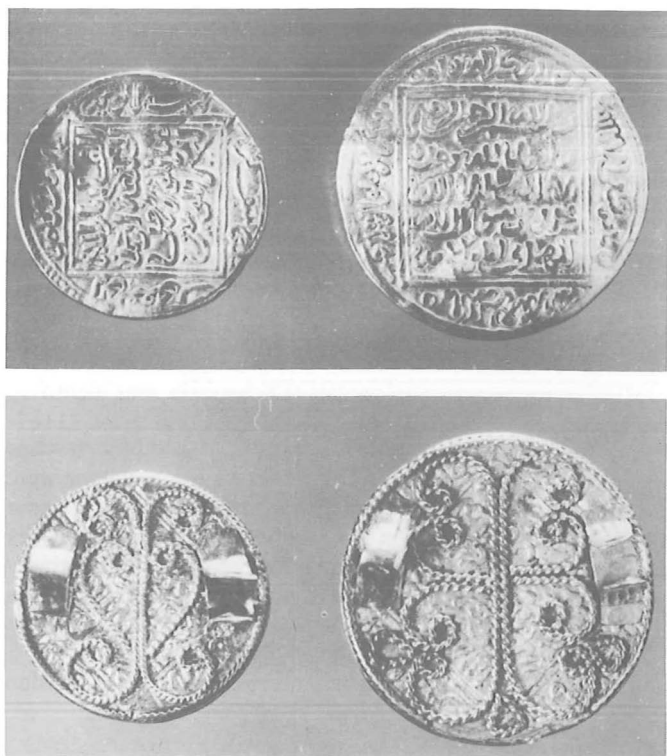
Fig. 1. De muntfibula's van Wirdum (links) en Scheemda (rechts), voor- en achterzijde. De fibula van Wirdum is vervaardigd van een dinar van Abu Yaqub Yusuf (1163-1184), die van Scheemda van een dobla van Abu Yusuf Yaqub al-Mansur (1184-1199). Schaal 3:2.

The coin brooches of Wirdum (left) and Scheemda (right), front and reverse. The Wirdum brooch is made of a dinar of Abu Yaqub Yusuf (1163-1184), the Scheemda one of a dobla of Abu Yusuf Yaqub al-Mansur (1184-1199). Scale 3:2.