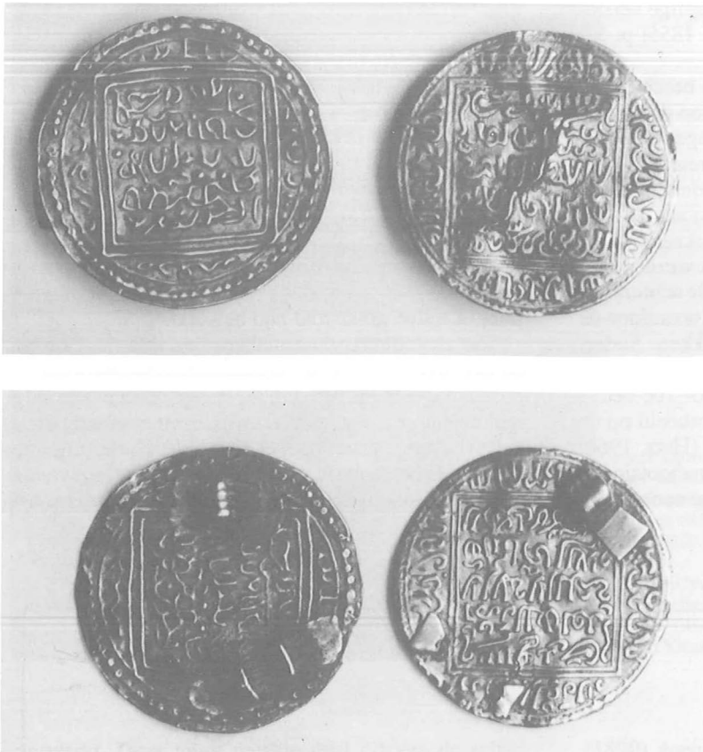
Fig. 3. De muntfibula's van Stavoren (links) en Damwoude (rechts), vervaardigd van lokale naslagen van Almohadische dobla's, voor- en achterzijde. Schaal 2:1.

The coin brooches of Stavoren (left) and Damwoude (right), made of local imitations of Almohad doblas, front and reverse. Twice real size.